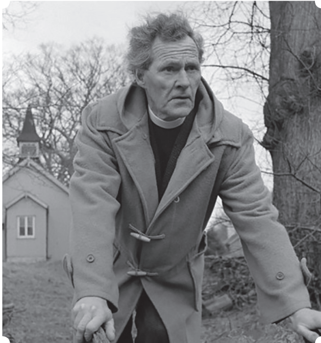
R S Thomas in front of The Iron Room.