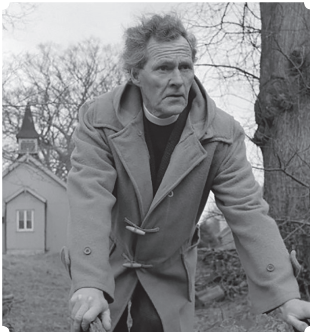
RS Thomas yn sefyll tu blaen i'r Ystafell Haearn.